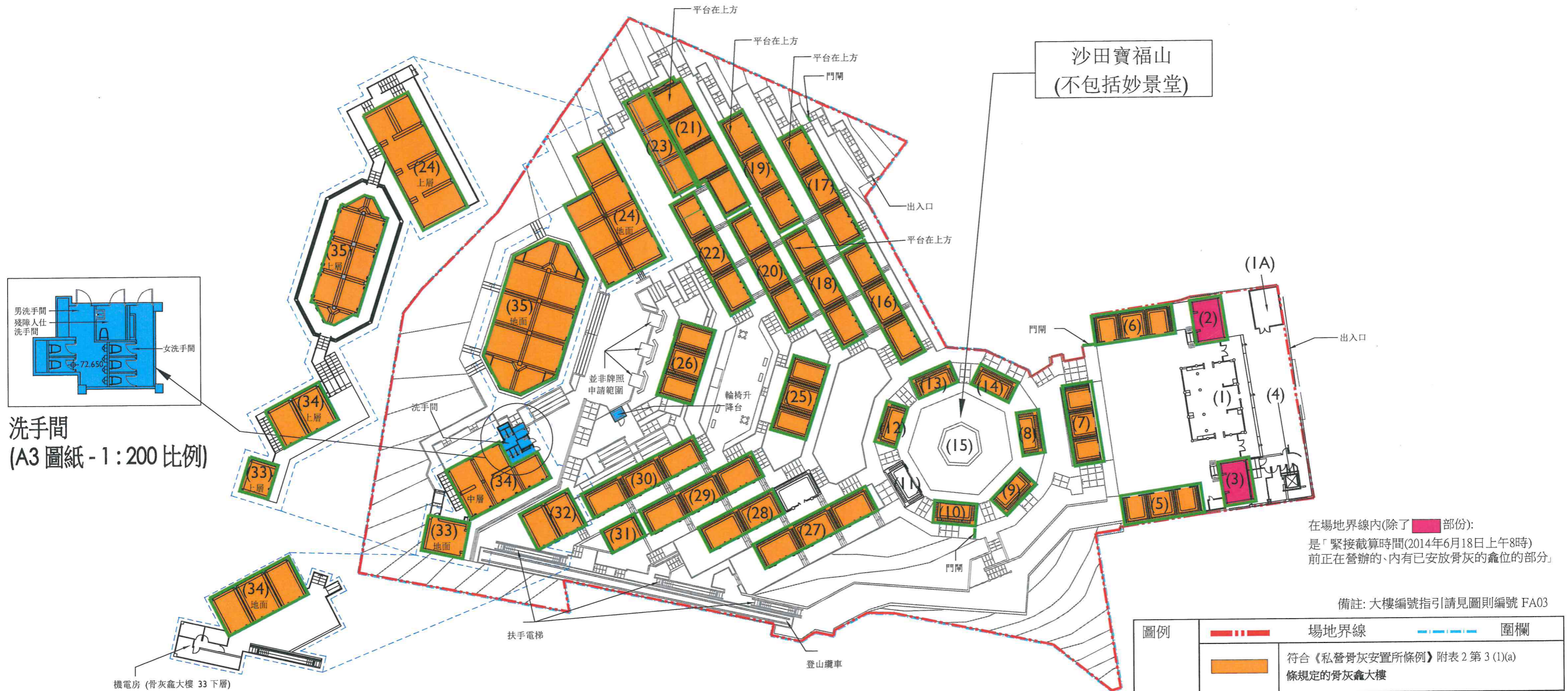
洗手間 (A3 圖紙 - 1:200 比例)